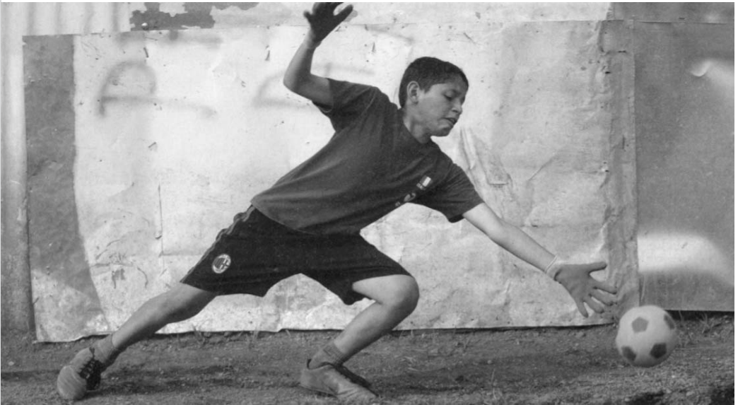
Fußball für das Leben: Kinder und Jugendsozialarbeit in den Elendsvierteln von San José, Costa Rica

Seit Jahren bekreuzigen sich immer mehr Spieler beim Betreten des Spielfeldes, vor dem Elfmeter oder nach dem Torerfolg. Die Frömmigkeit der brasilianischen Mann-